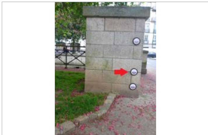
Boulevard Duplex - Pont Firmin - Février 1974

SOURCE DE REPÉRAGE : CAMPAGNE DE POSE DE REPÈRES DE CRUES - VILLE DE QUIMPER - SIVALODET - 28/12/2018