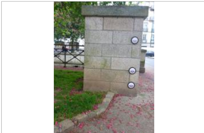
Boulevard Duplex - Pont Firmin en face du 11, rue Aristide Briand