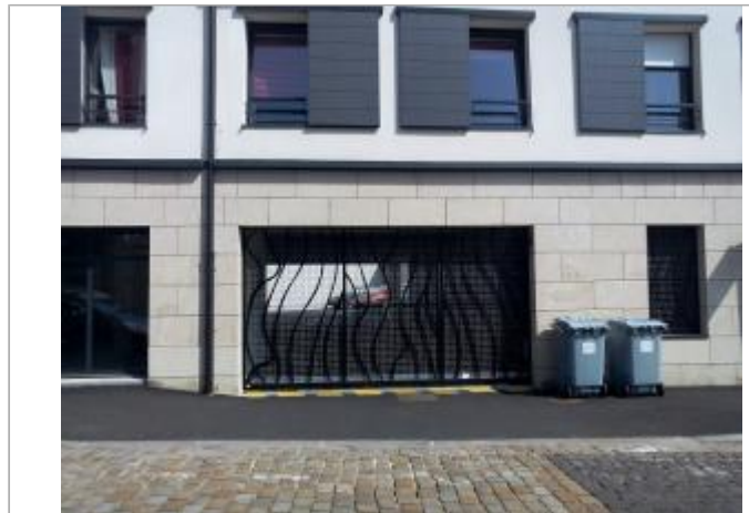
9, rue Toul Al Laër - Entrée de l'ex-Bibliothèque Municipale

Coordonnées WGS84 : X: -4.10052200 / Y: 47.99655600