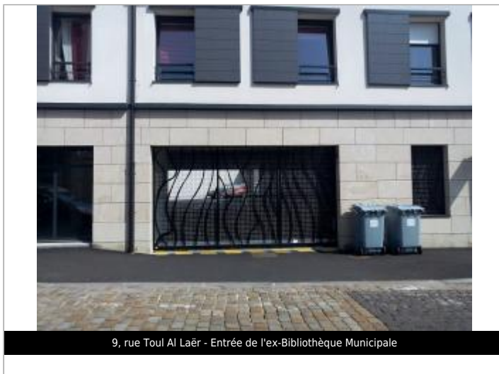
9, rue Toul Al Laër - Entrée de l'ex-Bibliothèque Municipale