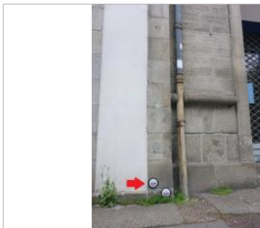
17, boulevard Amiral de Kerguélen - Février 1974