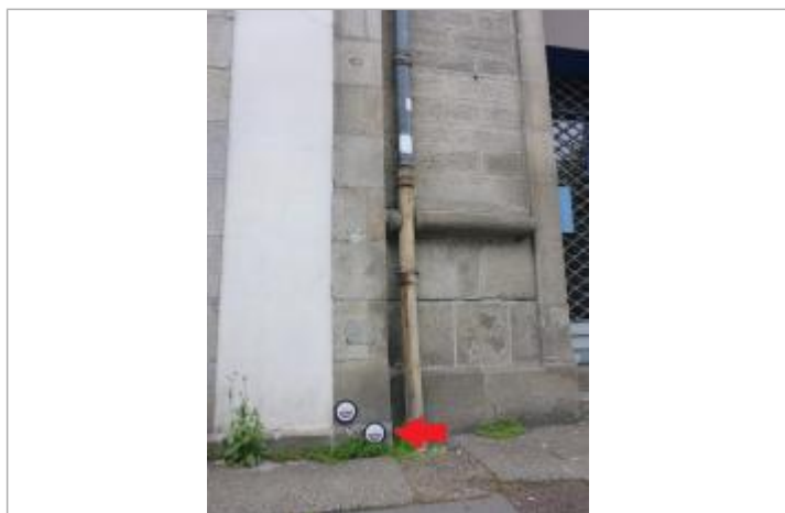
17, boulevard Amiral de Kerguélen - Janvier 1995