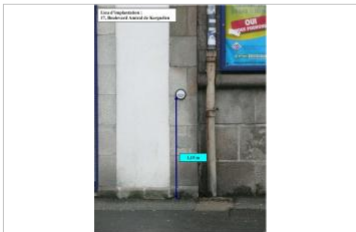
17, boulevard Amiral de Kerguélen - 13 décembre 2000