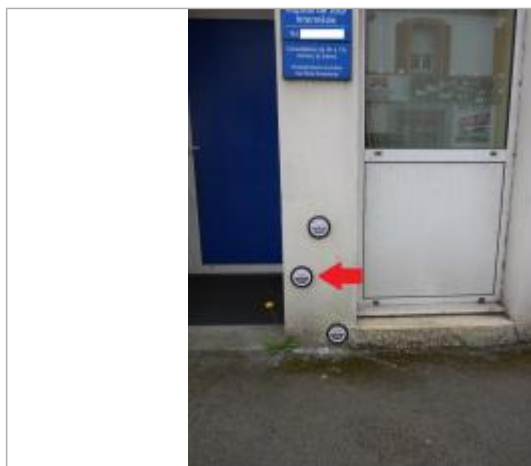
60-62, avenue de la Libération - Février 1974

Texte : Ville de Quimper - Inondation - Février 1974 - Odet