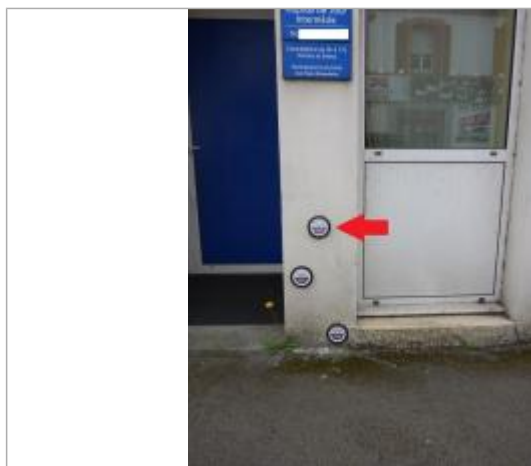
60-62, avenue de la Libération - 13 décembre 2000

Texte : Ville de Quimper - 13 décembre 2000 - Odet - Plus Hautes Eaux Connues