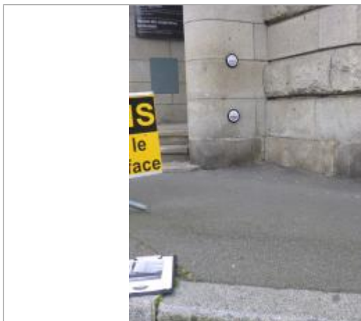
18, boulevard Duplex - Entrée du CDE (Département du Finistère)