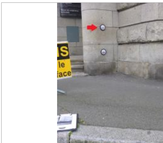
18, boulevard Duplex - 13 décembre 2000