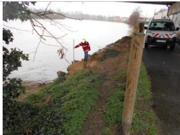
Vue du site - Source : DREAL Grand Est/CEREMA 2018