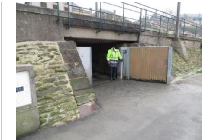
Vue du site - Source : DREAL Grand Est/CEREMA 2018