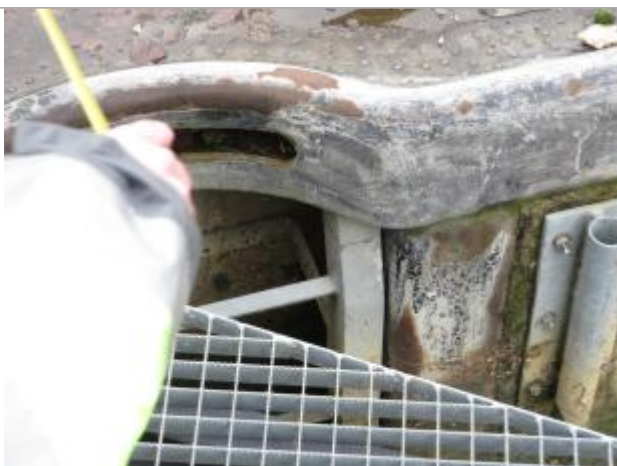
Vue du repère - Source : DREAL Grand Est/CEREMA 2018

Altitude calculée de l'eau (en m) : 146.2 m