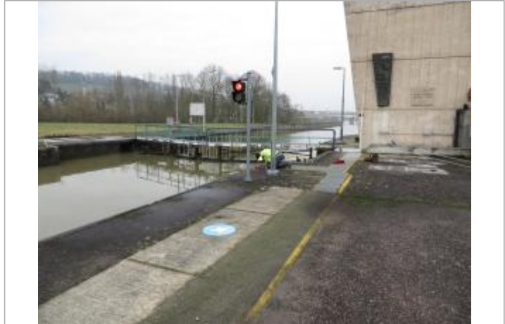
Vue du repère - Source : DREAL Grand Est/CEREMA 2018

MARQUE Maximum de l'inondation : Oui Visibilité : Oui État du repère : Moyen Pérennité : Moyenne Repère calculé : Non renseigné PHEC : Non renseigné