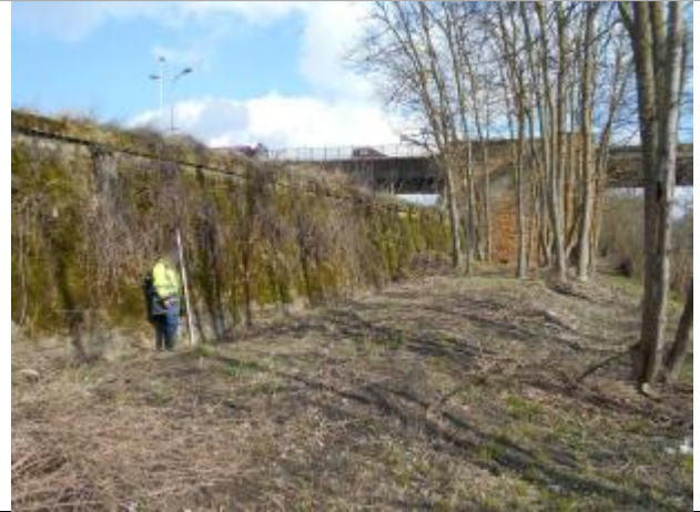
Vue du site - Source : DREAL Grand Est/CEREMA 2018