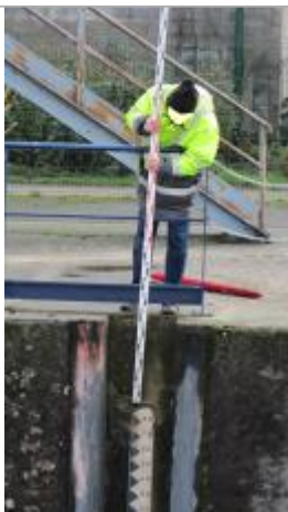
Vue du repère - Source : DREAL Grand Est/CEREMA 2018

Type de repérage : Campagne de terrain post-inondation