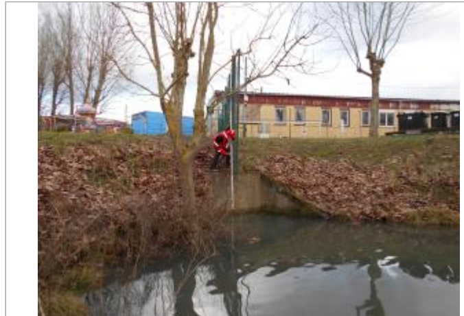
Vue du site - Source : DREAL Grand Est/CEREMA 2018

Coordonnées WGS84 : X: 6.12003000 / Y: 49.10510000