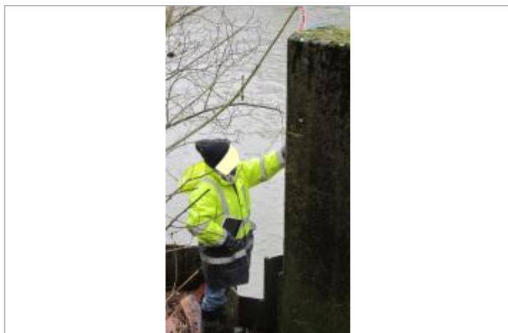
Vue du repère - Source : DREAL Grand Est/CEREMA 2018

Altitude calculée de l'eau (en m) : 178.7915