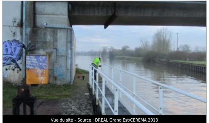
Vue du site - Source : DREAL Grand Est/CEREMA 2018