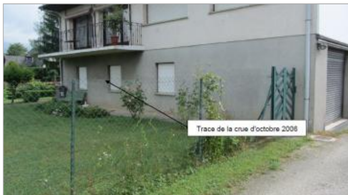
Trace encore visible en 2016 sur le crépis ciment du sous bassement de la maison

Texte : Trace très nette et encore visible sur la façade de la maison en mai/juin 2016