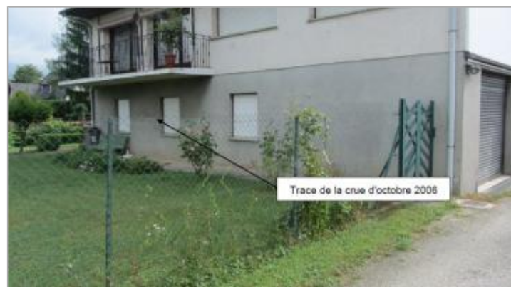
Trace encore visible en 2016 sur le crépis ciment du sous-bassement de la maison

GÉNÉRAL Code : Mir_TD_04 Date de mise à jour : 06/09/2019 Auteur : Cerema Est