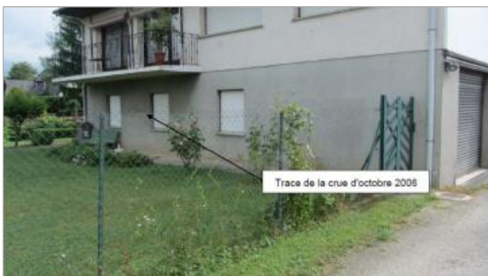
Trace encore visible en 2016 sur le crépis ciment du sous-bassement de la maison

Code : Mir_TD_04 Date de mise à jour : 06/09/2019 Auteur : Cerema Est