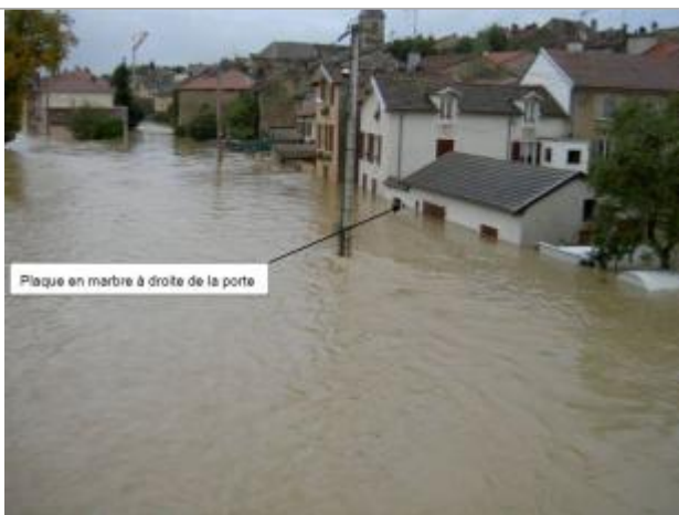
Mirecourt photo du 03/10/2006 à 18h08 pendant la crue d'octobre 2006 (Vue de l'amont RG depuis le pont du RD10 - rue du quai Barbacane)

Altitude calculée de l'eau (en m) : 267.408 m