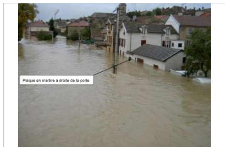
Mirecourt photo du 03/10/2006 à 18h08 pendant la crue d'octobre 2006 (Vue de l'amont RG depuis le pont du RD10 - rue du quai Barbacane)

GÉNÉRAL Code : Mir_TD_02 Date de mise à jour : 21/12/2018 Auteur : Cerema Est