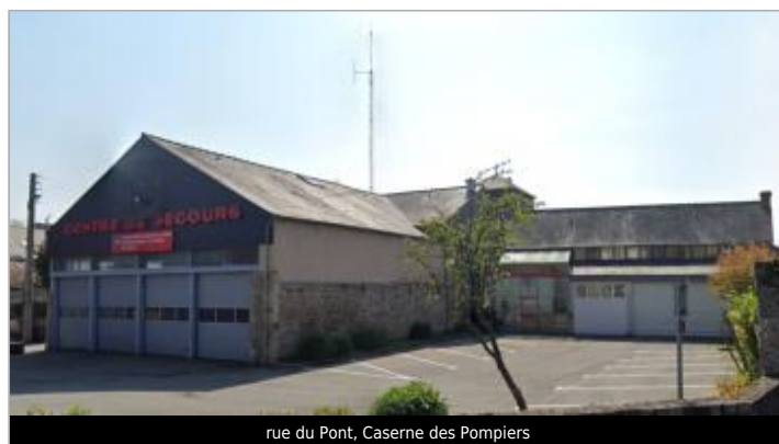
rue du Pont, Caserne des Pompiers