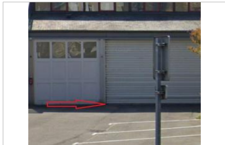
au niveau de la Caserne des Pompiers, à l'angle de l'ouverture de la cellule ambulance