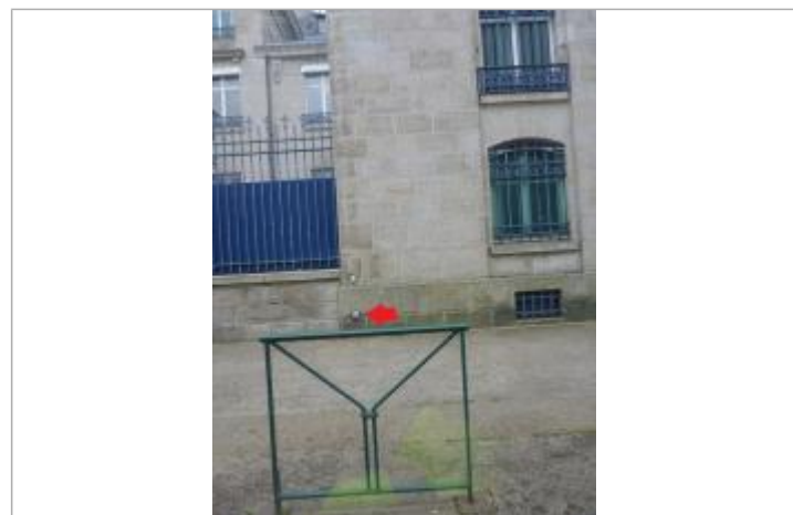
29, avenue de la Gare - Février 1974

GÉNÉRAL Code : ODET_24_1974 Date de mise à jour : 04/03/2022 Auteur : SIVALODET