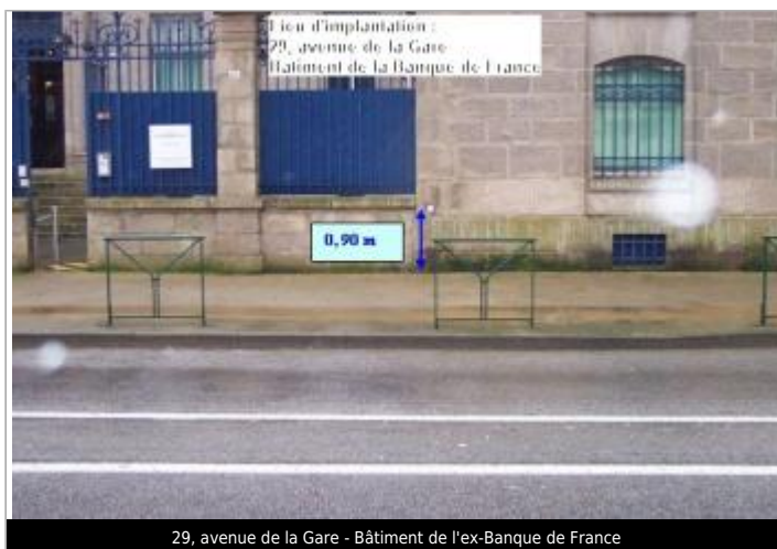
29, avenue de la Gare - Bâtiment de l'ex-Banque de France

GÉOLOCALISATION Coordonnées WGS84 : X: -4.09430360 / Y: 47.99435700 Coordonnées RGF93 (Lambert 93) X: 171565 / Y: 6789750.97 Coordonnées RGF93 (ETRS89) : X: -4.0943036 / Y: 47.994357 Code Hydro: J4--0190 Rive de référence: Gauche