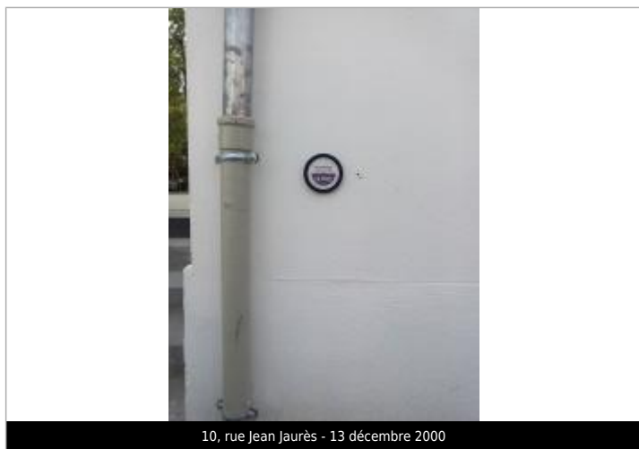
10, rue Jean Jaurès - 13 décembre 2000

Code : ODET_23_2000 Date de mise à jour : 04/03/2022 Auteur : SIVALODET