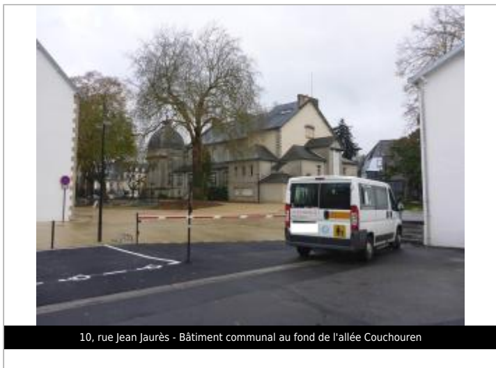
10, rue Jean Jaurès - Bâtiment communal au fond de l'allée Couchouren