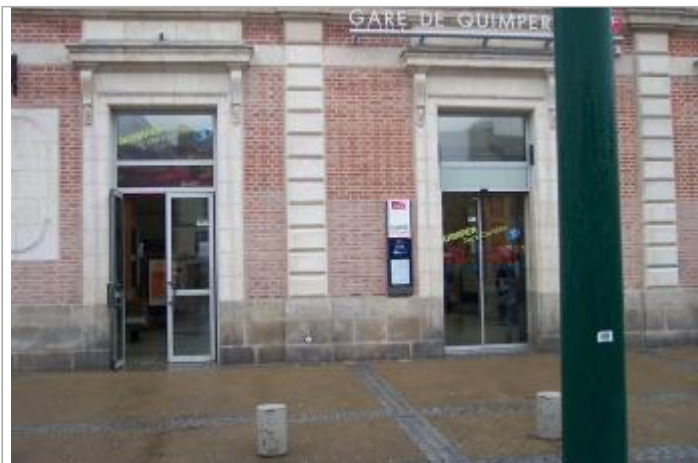
1, place Louis Armand - Entrée principale de la gare SNCF