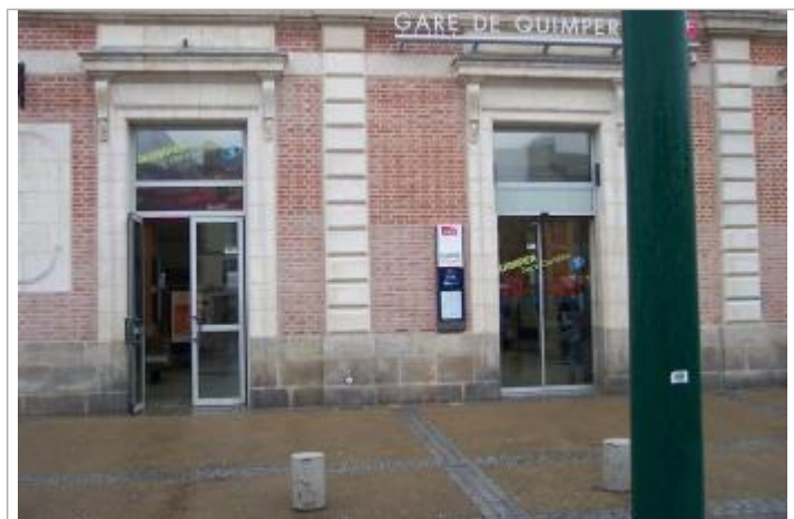
1, place Louis Armand - 13 décembre 2000

Méthode : Nivellement direct Référence nivelée : Marque d'inondation Système altimétrique : NGF IGN 1969 (système normal) Altitude de la référence (en m) : 6.530 m Altitude calculée de l'eau (en m) : 6.53 m