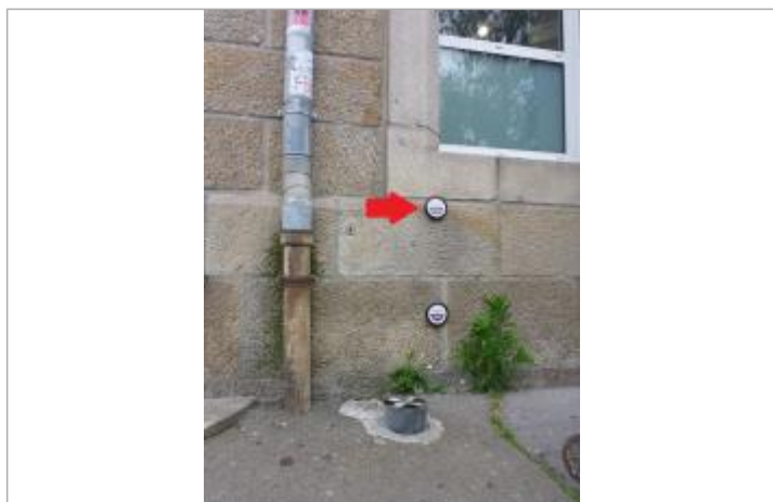
37, boulevard Amiral de Kerguelen - 13 décembre 2000