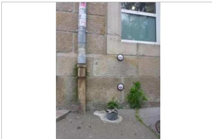
37, boulevard Amiral de Kerguelen - Entrée principale de la Poste