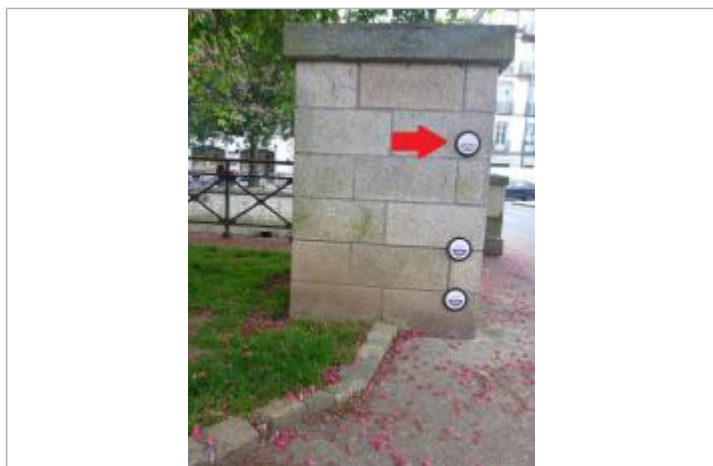
Boulevard Duplex - Pont Firmin - 13 décembre 2000