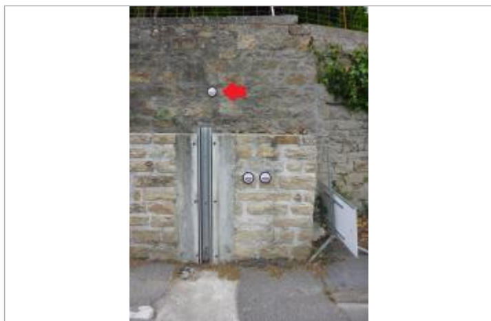
14, rue de l'Hippodrome - 13 décembre 2000