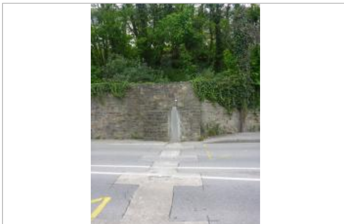
14, rue de l'Hippodrome - Batardeau