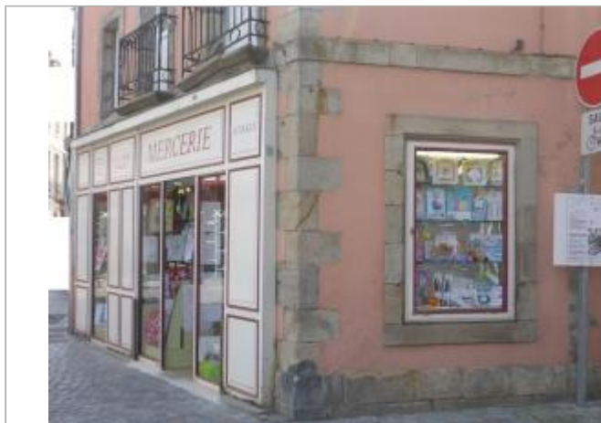
30, rue René Madec - Angle de la mercerie