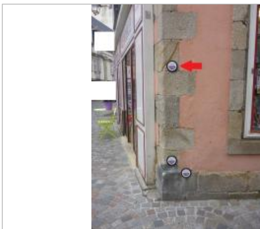
30, rue René Madec - 13 décembre 2000