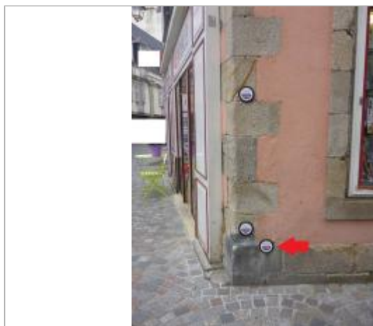
30, rue René Madec - Janvier 1995