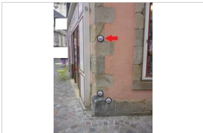
30, rue René Madec - 13 décembre 2000