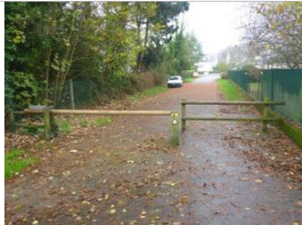
Rue Edmond Rostand - Promenade du Manoir des Salles