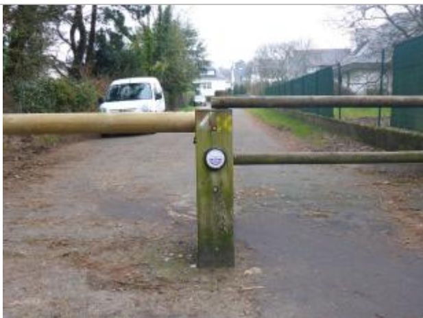
Rue Edmond Rostand - 13 décembre 2000