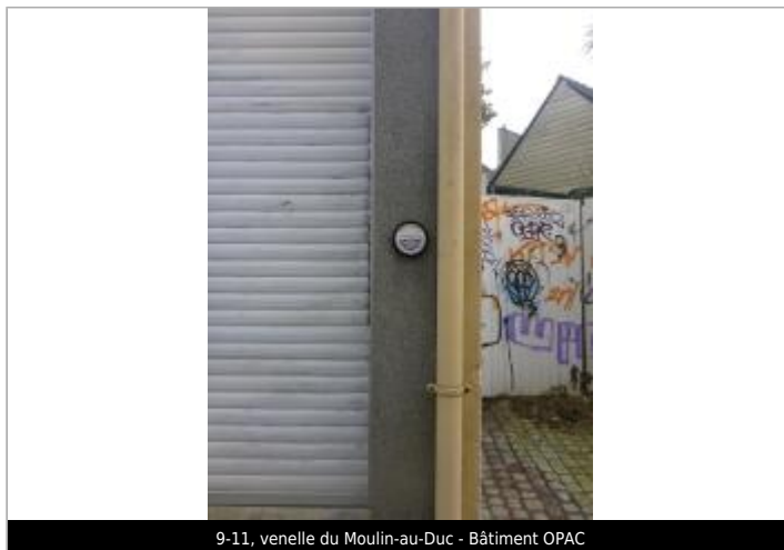
9-11, venelle du Moulin-au-Duc - Bâtiment OPAC