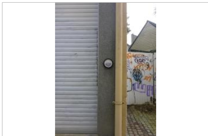
9-11, venelle du Moulin-au-Duc - 13 décembre 2000