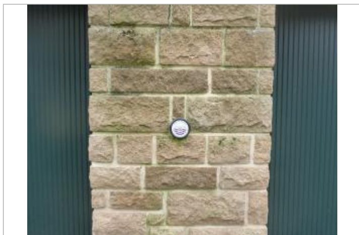
8 bis, rue Laënnec - 13 décembre 2000

Texte : Ville de Quimper - 13 décembre 2000 - Steïr - Plus Hautes Eaux Connues