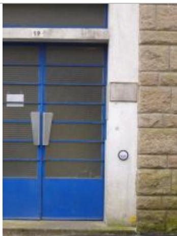
19, rue de la Palestine - 13 décembre 2000

Altitude calculée de l'eau (en m) : 4.25 m