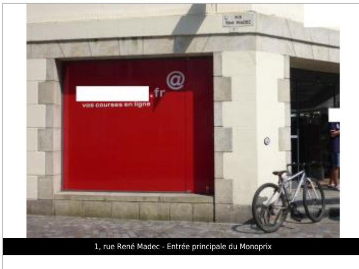
1, rue René Madec - Entrée principale du Monoprix