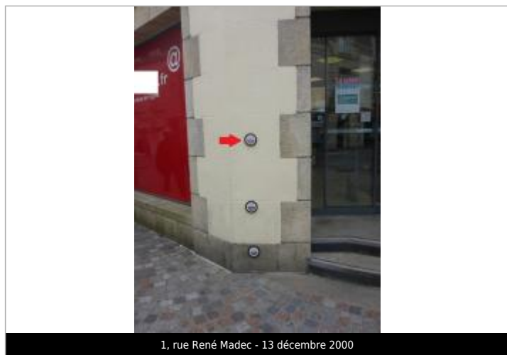
1, rue René Madec - 13 décembre 2000

Code : STEIR_27_2000 Date de mise à jour : 29/04/2023