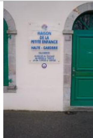
8, boulevard du Moulin-au-Duc - Maison de la Petite Enfance