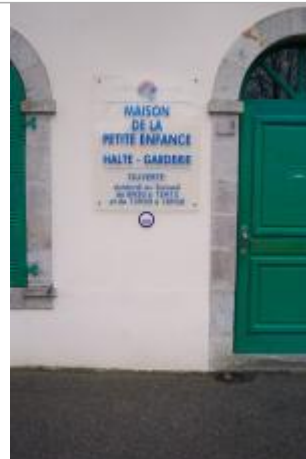
8, boulevard du Moulin-au-Duc - Maison de la Petite Enfance