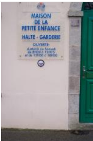
8, boulevard du Moulin-au-Duc - 13 décembre 2000

Altitude calculée de l'eau (en m) : 5.61