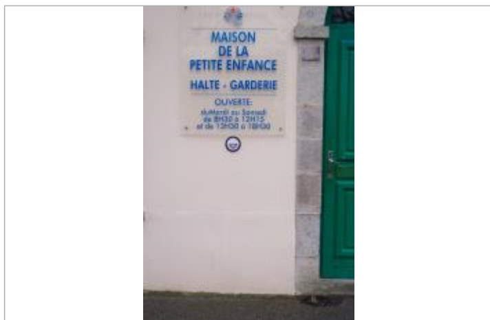
8, boulevard du Moulin-au-Duc - 13 décembre 2000