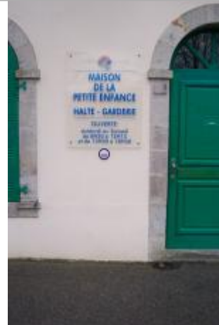
8, boulevard du Moulin-au-Duc - Maison de la Petite Enfance