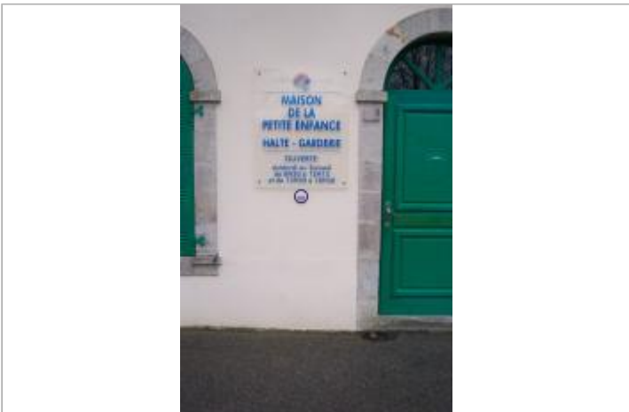
8, boulevard du Moulin-au-Duc - Maison de la Petite Enfance

GÉOLOCALISATION Coordonnées WGS84 : X: -4.10673970 / Y: 47.99754400 Coordonnées RGF93 (Lambert 93) X: 170673 / Y: 6790186.98 Coordonnées RGF93 (ETRS89) : X: -4.1067397 / Y: 47.997544 Code Hydro: J43-0300 Rive de référence: Droite