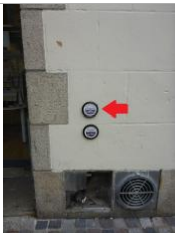
Quai du Port au Vin - 13 décembre 2000

Texte : Ville de Quimper - 13 décembre 2000 - Steïr - Plus Hautes Eaux Connues