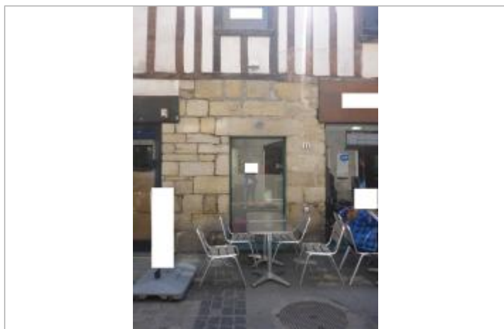
11, rue du Châpeau Rouge - 13 décembre 2000

Code : STEIR_21_2000 Date de mise à jour : 29/04/2023 Auteur : SIVALODET