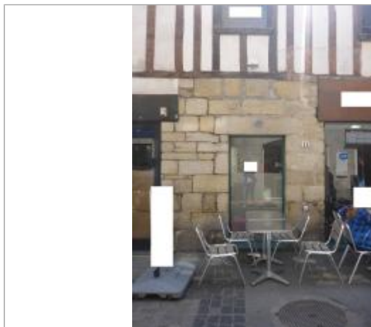
11, rue du Châpeau Rouge