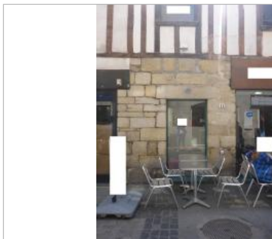
11, rue du Châpeau Rouge - 13 décembre 2000

Texte : Ville de Quimper - 13 décembre 2000 - Steïr - Plus Hautes Eaux Connues