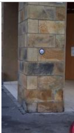
15, place Terre-au-Duc - 13 décembre 2000

Texte : Ville de Quimper - 13 décembre 2000 - Le Steir - Plus Hautes Eaux Connues