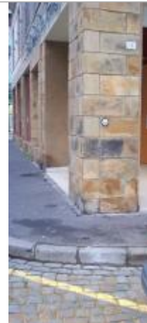
15, place Terre-au-Duc