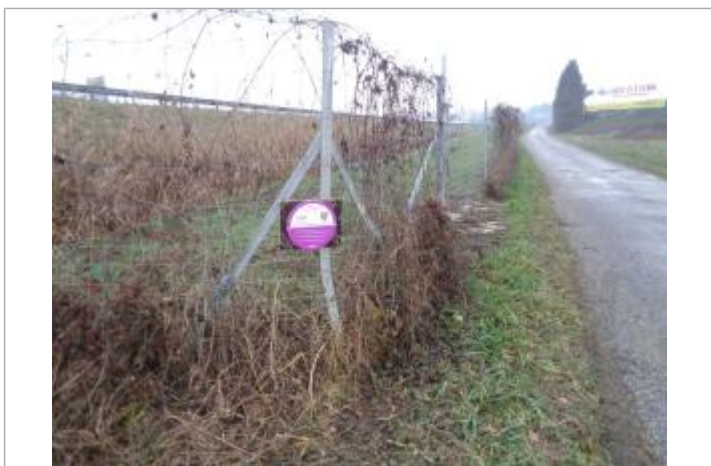
crue du 1 au 4 mai 2015 sur grillage sur voie communale n°9