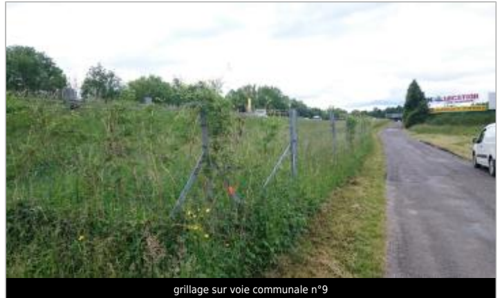
grillage sur voie communale n°9