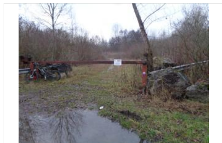
crue du 1 au 4 mai 2015 barrière sur la voie communale