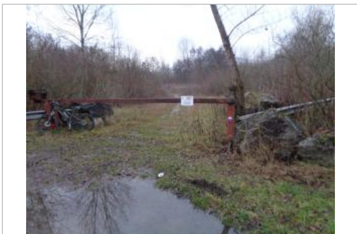
crue du 1 au 4 mai 2015 barrière sur la voie communale