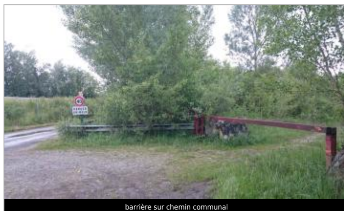
barrière sur chemin communal