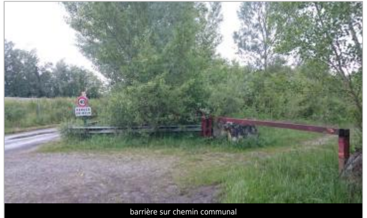
barrière sur chemin communal