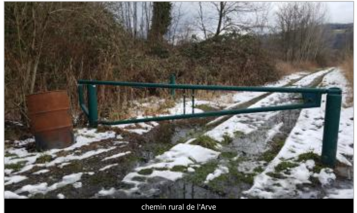
chemin rural de l'Arve