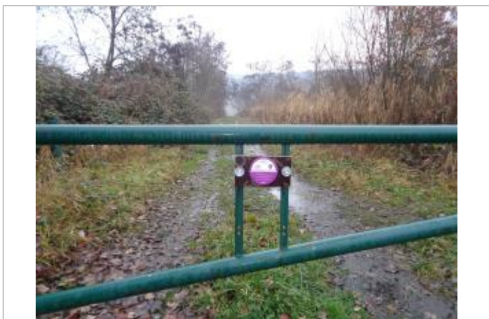
crue du 1 au 4 mai 2015 chemin de l'Arve à Scientrier