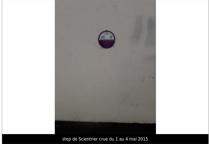
step de Scientrier crue du 1 au 4 mai 2015

MARQUE Texte : crue de l'Arve du 1 au 4 mai 2015 Maximum de l'inondation : Oui Visibilité : Oui État du repère : Bon Pérennité : Longue