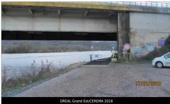
DREAL Grand Est/CEREMA 2018