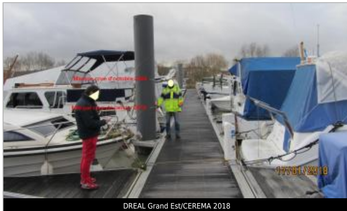
DREAL Grand Est/CEREMA 2018