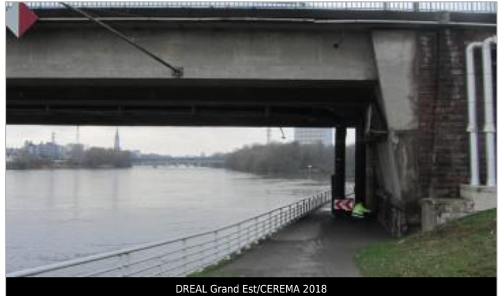
DREAL Grand Est/CEREMA 2018