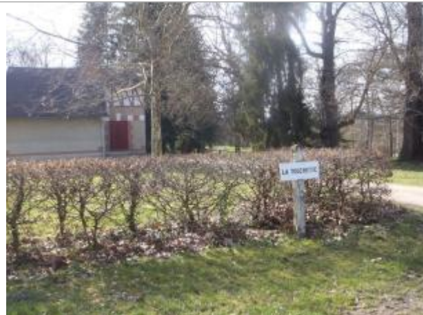
Vue du site (source : CEREMA, 2018)

Coordonnées WGS84 : X: 1.78141000 / Y: 47.52718300