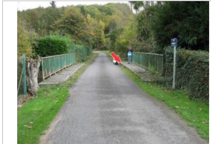
Site et repère de 2001