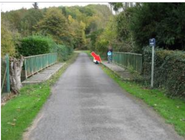
Repère de 2001

Altitude calculée de l'eau (en m) : 80.7 m