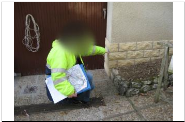
Repère de 2001 en 2008, face à l'armoire électrique

MARQUE Maximum de l'inondation : Non renseigné Visibilité : Non État du repère : Disparu Pérennité : Aucune Repère calculé : Non renseigné PHEC : Non renseigné