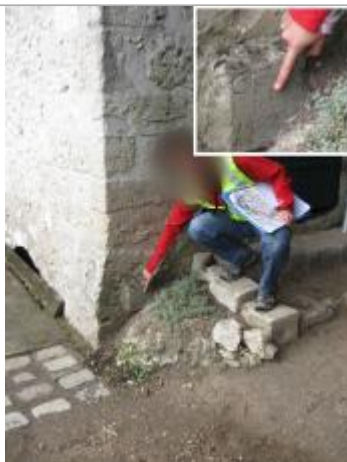
Repère de 1937 en 2008

Altitude calculée de l'eau (en m) : 78.86 m