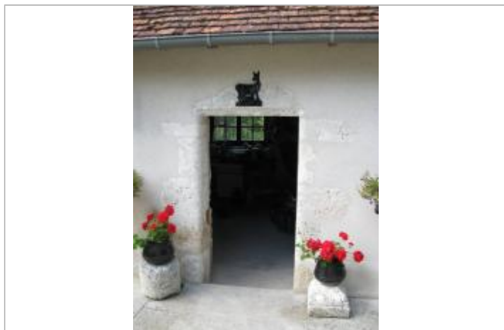
Repère de 2001

Altitude calculée de l'eau (en m) : 87.6