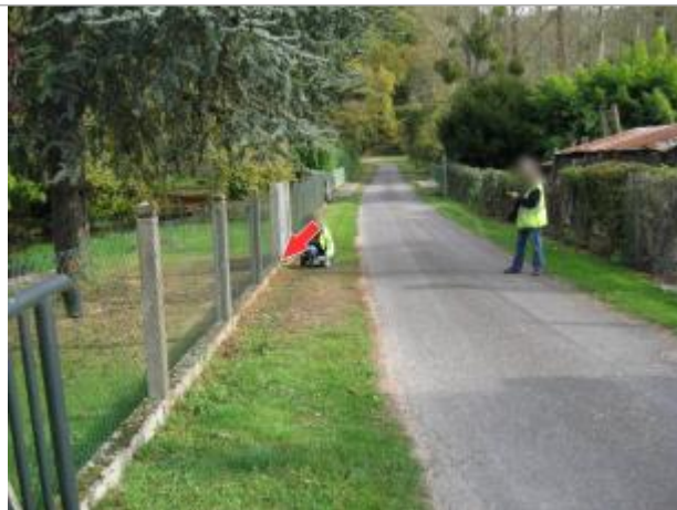
Site et repère de 2001