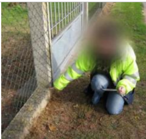
Repère de 2001 (source : CEREMA, 2008)

Altitude calculée de l'eau (en m) : 80.79