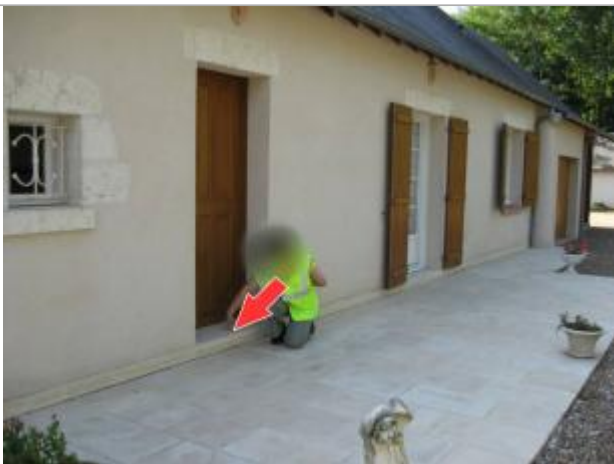
Repère de 2001

Altitude calculée de l'eau (en m) : 75.03