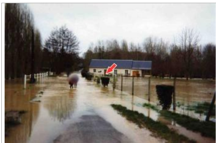
Site pendant la crue de 2001