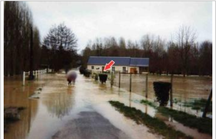
Site pendant la crue de 2001

Coordonnées WGS84 : X: 1.20768000 / Y: 47.56547000