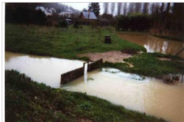
Site pendant la crue de 2001

Altitude calculée de l'eau (en m) : 74.11