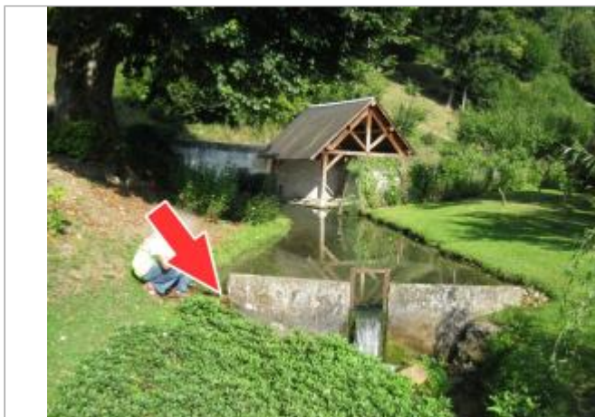
Site en 2008 et repère de 2001