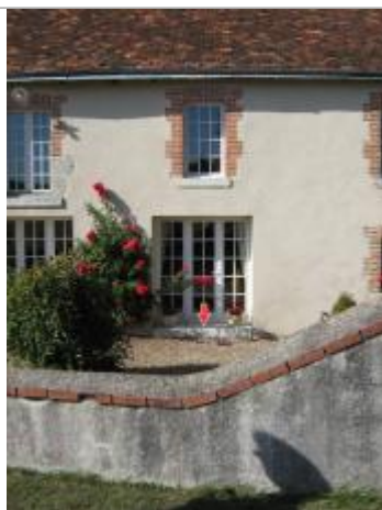
Repère de 2001

Altitude calculée de l'eau (en m) : 66.09